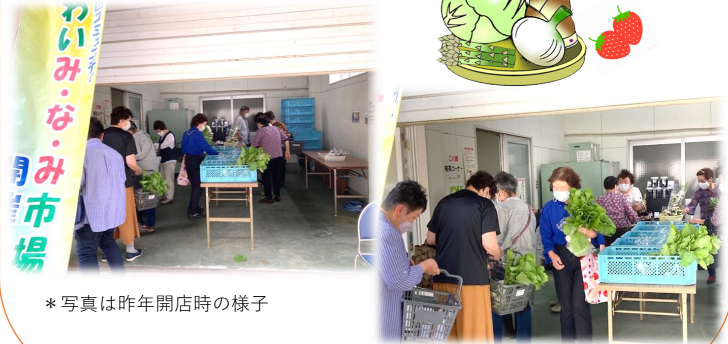
* 写真は昨年開店時の様子