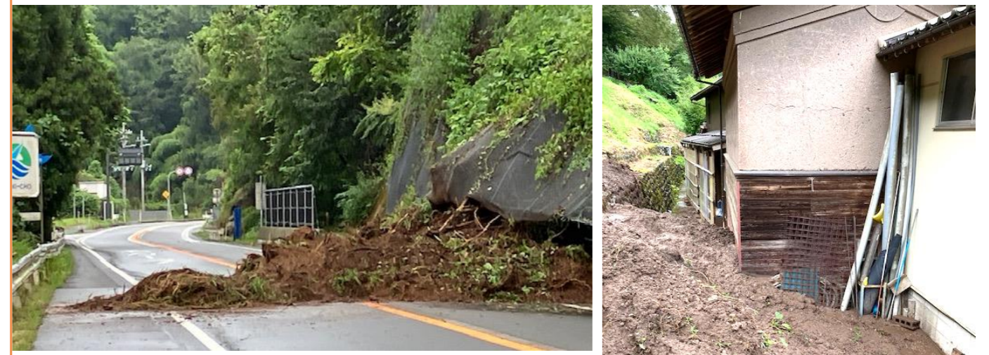
土生トンネル手間の土砂崩れと、大森区の裏山が崩れて1mほど裏庭が埋まった様子

避難も大雨が降ってからより、降る前に、夜ではなく、明るい昼間に避難するなど命を守る行動を自分や家族、近所と話し合い、早めに行動しましょう。